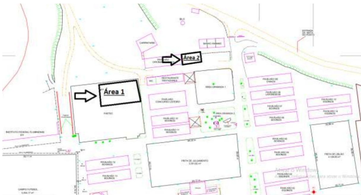
Figura 1 Demonstrativo para instalação dos postos médicos

ANEXO IV DO TERMO DE REFERÊNCIA DEMONSTRATIVO PARA INSTALAÇÃO DOS POSTOS MÉDICOS