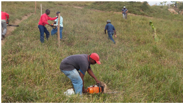
Trabalhadores retirando os troncos utilizados nas divisas de terrenos.

Após receber várias denúncias e ser acionada pelo Conselho Gestor da APA Municipal do Recanto das Palmeiras, sobre a invasão e construção de cercas dentro da Área de Proteção Ambiental, a Secretaria de Meio Ambiente de Cordeiro realizou operação para solucionar o problema, contando com o apoio de equipes das secretarias municipais de Agricultura e Defesa Civil, bem como do Setor de Fiscalização e Postura.