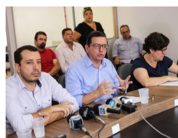
Rodrigo Romito (à esquerda) e o prefeito Renato Bravo

Renato Bravo, prefeito de Nova Friburgo, na Serra do Rio, anunciou nesta sexta-feira (6) os nomes que irão compor o Comitê de Gestão da Saúde. Durante entrevista coletiva, ele garantiu que não faltam médicos, nem medicamentos no Hospital Municipal Raul Sertã. O prefeito afirmou que o pro-