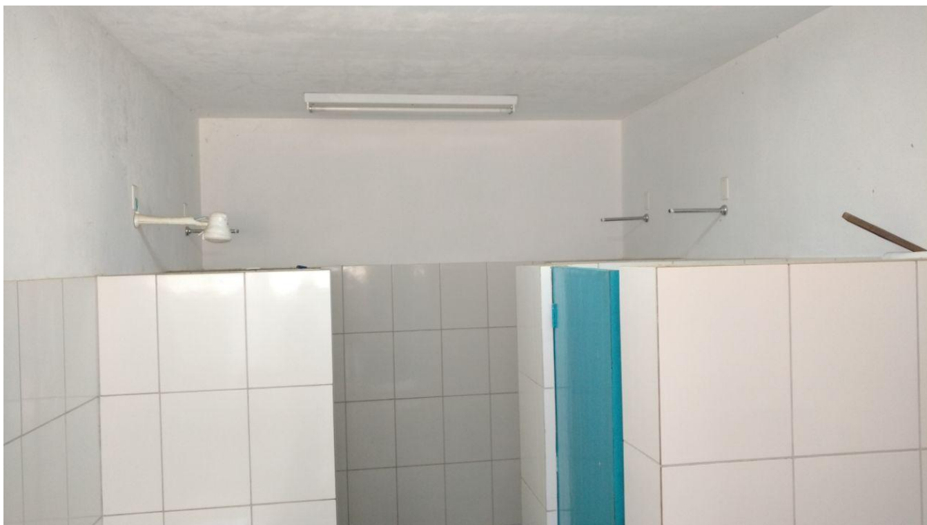
b) Vestiários: 42 m 2 total