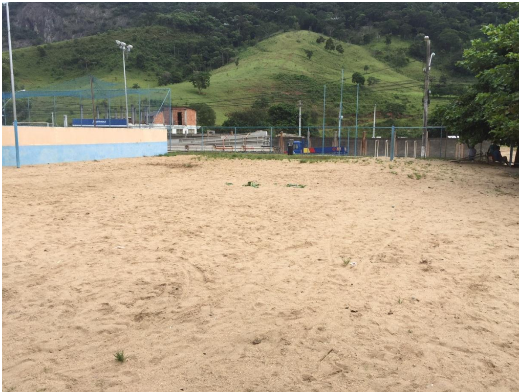
V – Anexo Q3 – Quadra de areia 1.457m 2