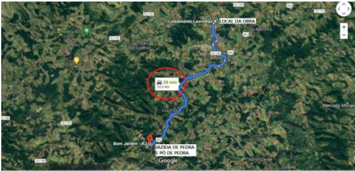
IMAGEM DA JAZIDA DE PEDRA: UTM – LONGITUDE: 763928.30 m E / LATITUDE: 7549908.03 m S