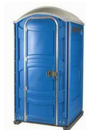
VISTA EXTERNA SEM ESCALA