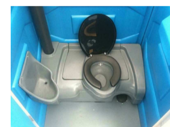
VISTA INTERNA SEM ESCALA