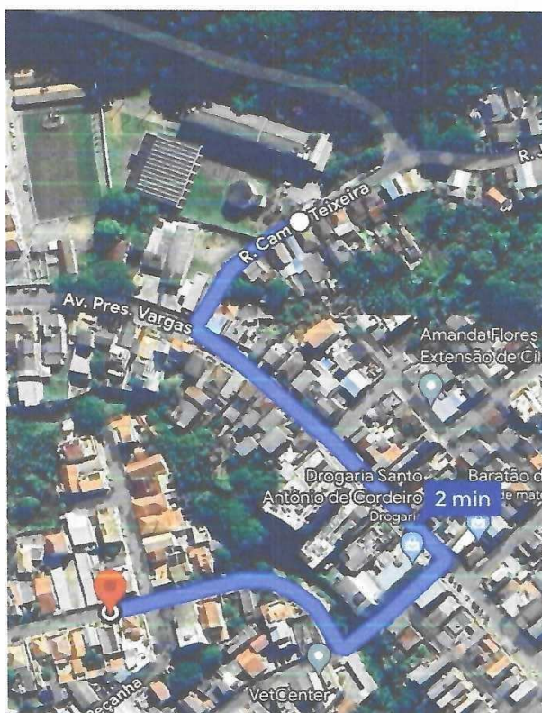
Imagem I - Corredor Viário